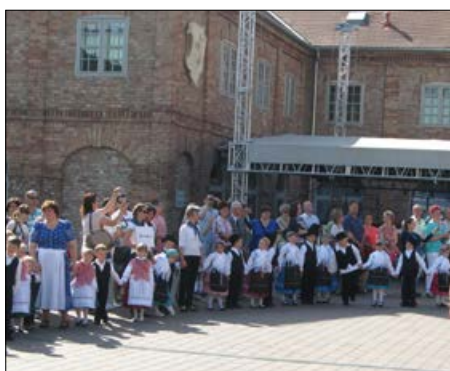
Fellépés a Zsolnay negyedben