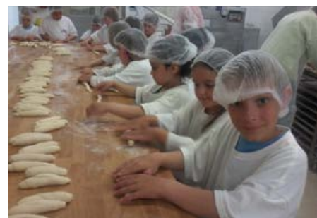
Üzemlátogatás az Aranycipő üzemében