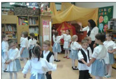
A szakmai napon Dunabogdányban

A Pécsvárad Szivárvány Német Nemzetiségi Óvoda és Bölcsőde éves programjai képekben: