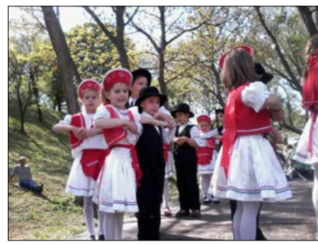
Fellépés a Város Napján