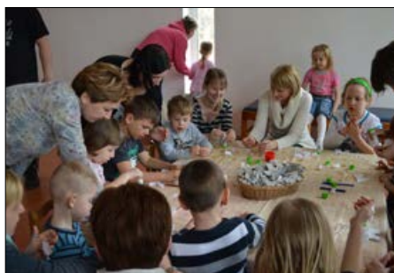
Húsvéti kézműves délután