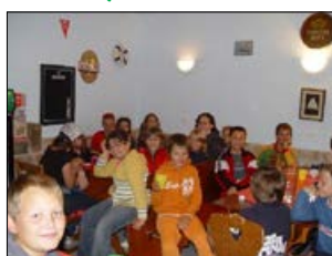
A fotók az 5. Német Táborban készültek 2008-ban.

Pécsvárad Hírmondó Pécsvárad Város Önkormányzatának lapja