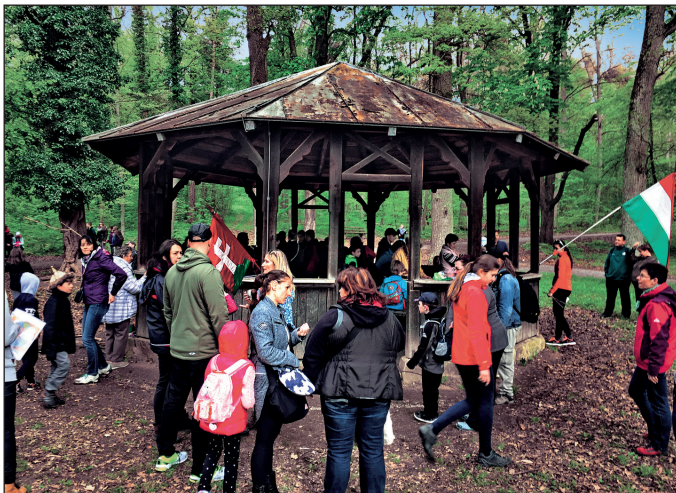
Magyar „honfoglalás” Ludwigsburgban!